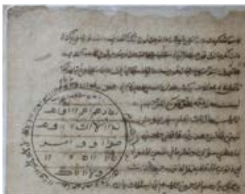
Gambar 6. Naskah Primbon koleksi Kraton Kacirebonan. Digitalisasi oleh Endangered Archive Programme The British Library EAP211/1/1/14 hal. 137. 22