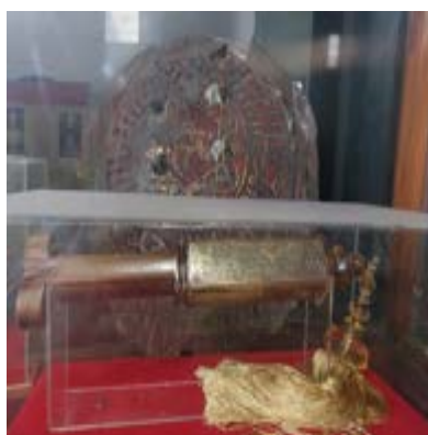
Gambar 3. Wifiq yang terdapat dalam tameng alat perang

Penulis juga menemukan beberapa benda yang menjadi koleksi museum Kasultanan Kanoman Cirebon yang diduga berkaitan dengan wifiq, seperti tameng senjata, baju perang, dan senjata. Menurut salah satu pemandu museum disana menyatakan bahwa perangkat perang yang digunakan oleh panglima pertama kesultanan Islam Cirebon tersebut menggunakan tameng yang tertulis rajah/wifiq. Menurutnya peralatan tersebut digunakan kira-kira abad 15-16. Wifiq tersebut ditulis dengan huruf arab, sangat disayangkan sekali tulisannya tidak bisa dibaca secara lengkap, hanya terlihat tulisan dua kalimat syahadat.