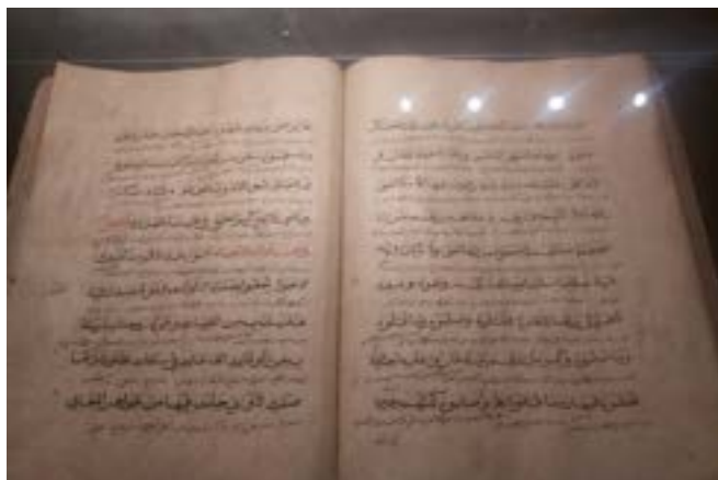
Gambar 4. Manuskrip tentang Hizib

Menurut pemandu museum bahwa manuskrip ini menggunakan kertas Eropa yang ditulis sekitar abad 19-20 an. Selain manuskrip tentang hizib tertapat juga manuskrip terkait dengan tasawuf.