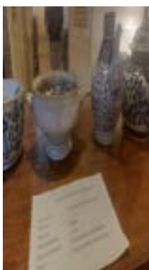
Gambar 5. Guci keramik bertuliskan ayat kursi

Penulis juga menemukan koleksi selain manuskrip seperti guci bertuliskan ayat kursi dan kaligrafi bahasa arab yang berbentuk keris. Guci keramik dibuat pada tahun 1940 yang terdapat di kesultanan Kacirbonan yang berfungsi sebagai tempat air dalam prosesi mauludan. Penulis berpendapat guci tersebut dapat digolongkan dalam bentuk wifiq. Masih ada beberapa peninggalan yang terindikasih kuat termasuk dari wifiq dalam bentuk yang beragam.