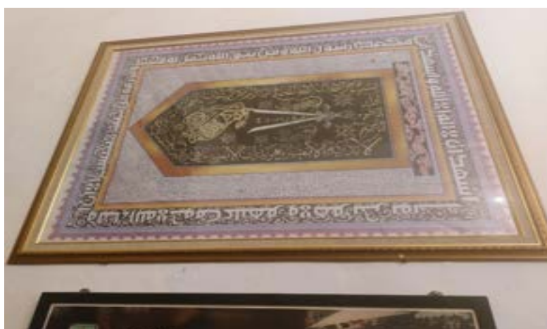
Gambar 1. Panji Kesultanan Islam Cirebon

Ilmu wifiq datang di Cirebon kurang lebih pada abad ke-14 M atau awal abad ke-15 M. Hal ini didasarkan data yang penulis temukan. Pendapat ini penulis sandarkan berdasarkan panji atau bendera Kesultanan Islam Cirebon. Gambar bendera tersebut dapat kita lihat disalah satu koleksi di museum Kesultanan Kanoman Cirebon hingga sekarang. Menurut pemandu museum Kesultanan Kanoman menjelaskan panji kebesaran ini sudah ada pada masa Sunan Gunung Jati (Syekh Syarif Hidayatullah), berarti panji ini sudah ada sekitar abad 15. Sangat disayangkan penulis masih belum menemukan manuskrip terkait ilmu wifiq yang ada pada abad tersebut. Ada dua tokoh awal yang ada di daerah Cirebon yaitu pertama, Syaikh Nur Jati (ada di Cirebon sekitar abad ke-14) 19 atau Syekh Datuk Kahfi, putra dari Syekh Datuk Ahmad. Kedua, Syekh Datuk Sholeh merupakan adik dari Syekh Datuk Ahmad. Syekh Datuk Sholeh memiliki anak yang bernama Syekh Siti Jenar (Abdul Jalil). 20 Dua tokoh ini yang kemungkinan besar membawa ilmu hikmah termasuk Ilmu wifiq di daerah Cirebon, dengan alasan bahwa keduanya adalah tokoh tasawuf.