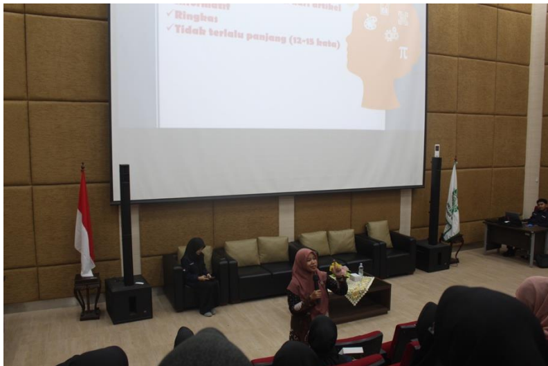
Gambar 2. Pemaparan Materi oleh Narasumber

Setelah pemaparan materi dilanjutkan dengan diskusi tanya jawab. Para peserta antusias ketika diskusi tanya jawab. Para peserta juga diberikan kesempatan untuk merancang penelitian sesuai dengan materi yang telah diberikan dan kemudian merancang judul serta metode untuk penulisan artikel ilmiah. Acara workshop selesai ditutup dengan ramah tamah dan foto bersama (disajikan pada Gambar 3.).