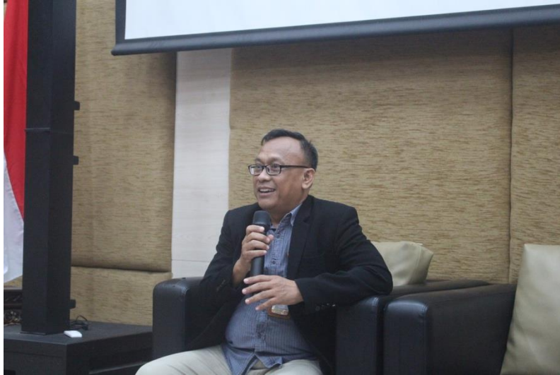
Gambar 1. Sambutan oleh Ketua Jurusan Biologi