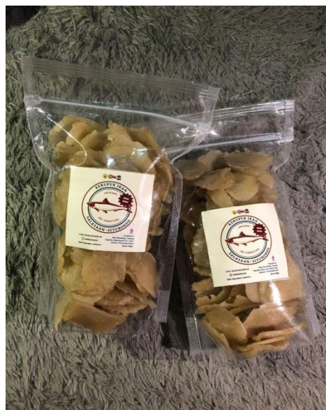
Gambar 4. Branding produk

Pemilihan program kerja pendampingan branding produk didasarkan pada kurangnya kemampuan dan pemahaman pemilik UMKM untuk membuat logo atau kemasan pada produknya. Hal tersebut terjadi karena rata-rata pelaku usaha memiliki usaha yang sudah dewasa dengan kisaran 40-an tahun dan tingkat pendidikan yang masih rendah. Kegiatan pendampingan branding produk diawali dengan pembuatan desain logo yang kemudian didiskusikan bersama para pelaku usaha. Pemilik UMKM diberikan penjelasan mengenai logo yang telah selesai melalui tahap desain awal. Logo juga memuat beberapa komponen, yaitu nama pemilik usaha, komposisi, legalitas usaha, sertifikasi halal, tanggal kadaluarsa, dan komponen lainnya. Logo dicetak menggunakan kertas maupun yang berbentuk stiker. Terdapat variasi pada logo yang berkaitan dengan ukuran logo, berat produk pada setiap kemasan, dan sesuai dengan kemasan yang akan digunakan. Kemasan berupa plastik PP dan standing pouch , dimana penggunaannya sesuai dengan keinginan dari pemilik usaha dan sasaran penjualan.