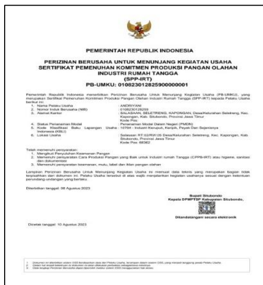
Gambar 2. SPP-IRT

Submission (OSS). Penggunaan layanan satu pintu tersebut diatur oleh pemerintah melalui PP No. 24 Tahun 2018 yang tujuan utamanya untuk memudahkan para pelaku usaha dalam mendapatkan legalitas. Nomor Induk Berusaha akan menjadi semacam payung hukum bagi para pelaku usaha untuk menjalankan UMKM yang telah dijalankan. NIB juga dapat dimanfaatkan oleh para pemilik UMKM khususnya yang memproduksi kerupuk ikan dalam aspek bantuan modal dan lainnya. PIRT berfungsi sebagai jaminan produk berkualitas yang dihasilkan oleh usaha rumahan dengan skala kecil sehingga produk yang dihasilkan dapat bersaing dengan produk-produk lainnya (Purborini, 2023). Legalitas yang telah dimiliki tentunya membuat para pemilik UMKM harus menjaga standar keamanan maupun kebersihan atas proses produksinya hingga proses pemasaran produk.