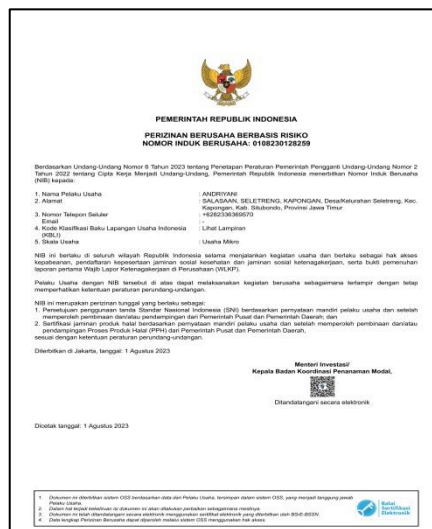
Gambar 1. Nomor Induk Berusaha (NIB)

Mayoritas UMKM yang dikelola oleh masyarakat masih belum memiliki dokumen legalisasi usaha. Hal tersebut terjadi karena para pelaku usaha belum memahami mekanisme untuk mengajukan legalisasi usaha atau juga disebabkan faktor lainnya sehingga pelaku usaha belum mengurus legalitas. Adanya persoalan pada rintisan UMKM kerupuk ikan yang khususnya berkaitan dengan legalitas dapat diselesaikan dengan adanya program pendampingan untuk mengajukan legalisasi tersebut. Dokumen legalitas usaha dapat berupa Nomor Induk Berusaha (NIB), SPP-IRT, dan sertifikasi halal. Legalitas usaha sangat penting karena dapat mempengaruhi tingkat kepercayaan konsumen terkait dengan kemanan saat mengkonsumsi produk. Adanya legalitas usaha dapat meluaskan kesempatan dalam upaya pengembangan usaha, lebih dipercaya. pelaku usaha memiliki rasa percaya diri yang kuat dalam pemasaran produk (Hana dkk, 2023). Legalitas yang telah didapatkan nantinya akan dicantumkan pada logo kemasan, sehingga dapat diketahui oleh para konsumen.