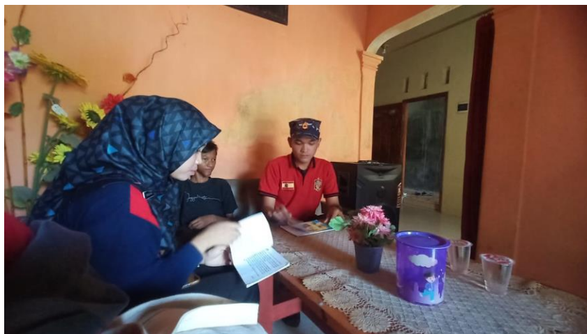
Gambar 3. Dokumentasi Komunitas Literasi (Program Bimbingan Membaca)

Selain bekerjasama dengan pihak perpustakaan dalam menyediakan buku berkualitas. Tim pengabdian juga membuka program bimbingan membaca untuk dapat meningkatkan minat dan kemampuan membaca siswa. Program bimbingan membaca dilakukan dengan cara mendatangi rumah para peserta didik.