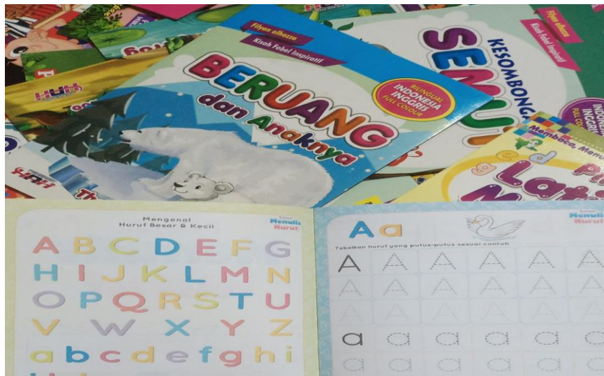
Gambar 2. Dokumentasi Tim Pengabdian (Bahan Buku Bacaan)

baca siswa. Sebagaimana hasil penelitian Artana (2016) dan Nurida, dkk (2015) bahwa menyediakan buku berkualitas dapat meningkatkan kemampuan dan minat baca siswa.