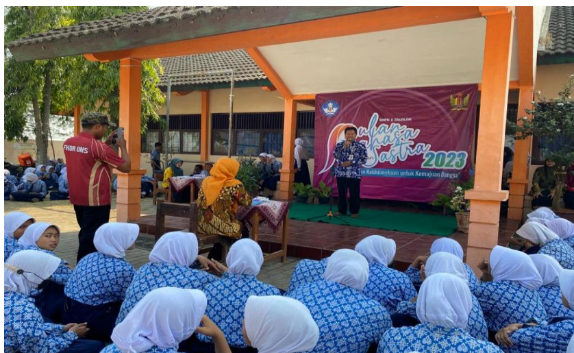
Gambar 5. Dokumentasi Tim Pengabdian (Lomba Literasi dalam Rangka Hari Bulan Bahasa)

Festival literasi merupakan salah satu cara yang dilakukan oleh tim pengabdian untuk meningkatkan minat dan budaya membaca. Kegiatan seperti ini bertujuan untuk memotivasi para peserta agar lebih banyak membaca. Hal tersebut sejalan dengan Permendikbud No 23 Tahun 2015 tentang Pendidikan Budi Pekerti yang didalamnya salah satunya yaitu kewajiban menjalankan kegiatan membaca non-pelajaran selama 15 menit setiap hari. Oleh sebab itu, tim pengabdian membuat program kegiatan festival literasi. Adapun pertunjukan literasi ini lebih spesifik kepada tema “sastra”, dimana para peserta dapat memilih salah satu sastra seperti membaca puisi, membuka UUD 1945 atau story telling .