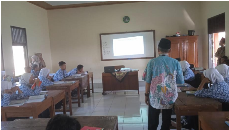
Gambar 4. Dokumentasi Tim Pengabdian (Keterlibatan Guru dalam Membimbing Siswa)

untuk menciptakan hubungan positif antara keluarga dan literasi serta dapat memberikan saran yang kepada anak untuk lebih meningkatkan membacanya.