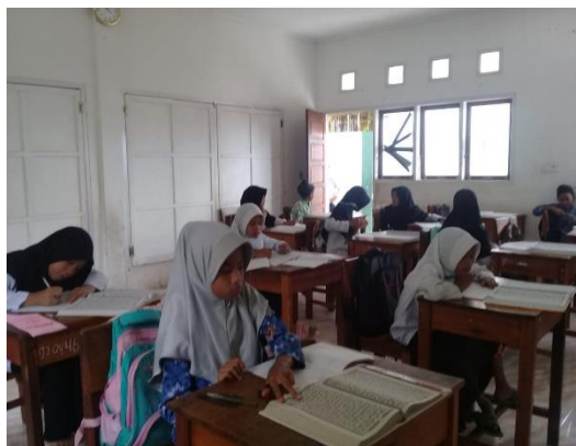
Gambar 1. Kegiatan Membaca Al-Qur'an

Pada minggu ke-1 dan ke-2 kemampuan membaca siswa masih sangat rendah. Siswa masih belum lancar dan masih gugup dalam membaca al-qur'an. Pelafazan huruf siswa tersebut masih belum jelas dan masih tersendat-sendat. Begitu juga dengan penempatan harakat atau tanda bacanya masih banyak yang salah. Hal tersebut menyebabkan kesalahan kaidah-kaidah tajwid dalam membacanya. Kondisi tersebut hampir sama di ke-2 kelas yaitu kelas 3 dan kelas 4. Pada minggu ke-3 dan ke-4 kemampuan membaca siswa sudah ada sedikit kemajuan. Siswa yang awalnya gugup sudah mulai timbul rasa tenang dalam membaca al-qur'an meskipun masih belum lancar. Pelafazan huruf pada saat siswa membaca al-qur'an sudah mulai jelas walaupun masih sedikit tersendat. Kesalahan dalam penempatan harakat atau tanda baca mulai berkurang. Pada minggu ke-5 dan ke-6 kemampuan membaca siswa mulai meningkat. Beberapa siswa mulai lancar dan tidak gugup lagi dalam membaca al-qur'an. Pelafazan huruf saat membaca al-qur'an sudah jelas. Penempatan harakat atau tanda baca sudah benar dan penempatan kaidah-kaidah tajwid sudah sesuai. Pada minggu ke-7 dan ke-8 kemampuan membaca siswa mengalami peningkatan. Banyak siswa yang lancar dan tidak gugup lagi dalam membaca al-qur'an. Pelafazan huruf saat membaca al-qur'an sudah jelas. Penempatan harakat atau tanda baca sudah benar dan penempatan kaidah-kaidah tajwid sudah sesuai.