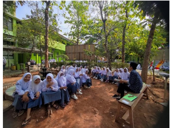
Gambar 1. Sosialisasi Materi Penulisan Karya Tulis Ilmiah