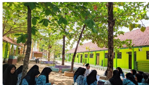
Gambar 2. Pendampingan Penulisan Karya Tulis Ilmiah

Sebagai bentuk evaluasi dan apresiasi, di akhir kegiatan siswa mempresentasikan hasil karya tulis mereka di hadapan guru dan rekan-rekan lain dalam forum “Mini Seminar Siswa”. Kegiatan ini tidak hanya menjadi ajang evaluasi hasil belajar, tetapi juga melatih keterampilan komunikasi akademik dan meningkatkan rasa percaya diri siswa.