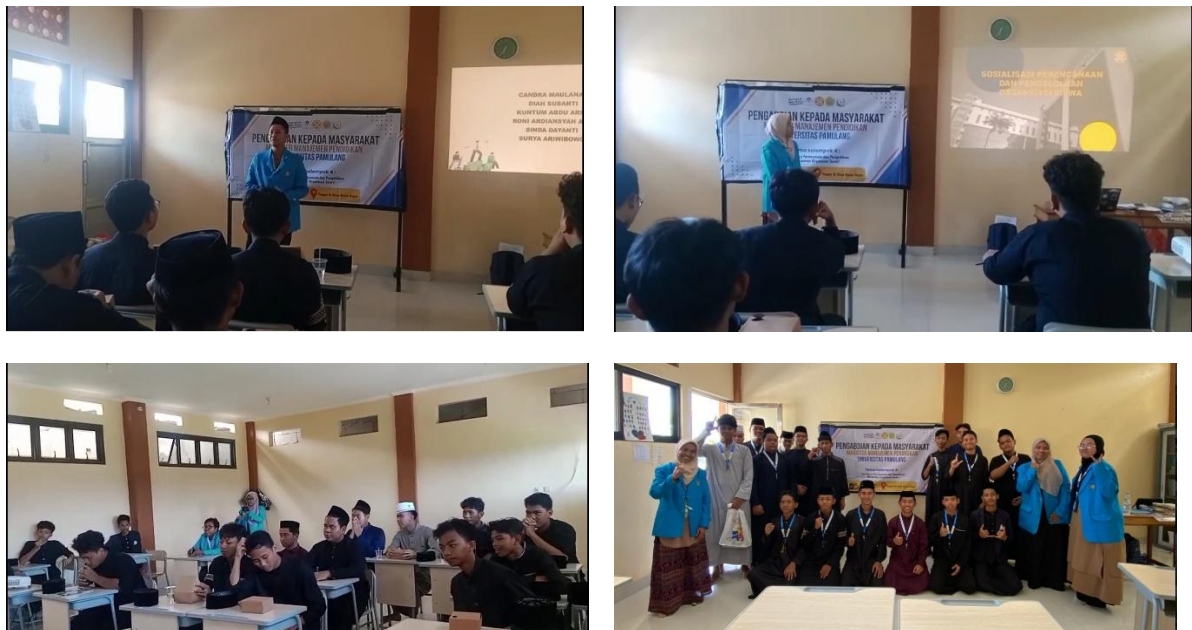
Gambar 2. Dokumentasi Selesai Kegiatan

Pelaksanaan kegiatan berhasil menghasilkan beberapa output yang dapat diukur secara langsung. Partisipasi aktif santri ikhwan pengurus organisasi menunjukkan antusiasme tinggi, baik dalam diskusi, tanya jawab, maupun simulasi penyusunan program kerja. Hal ini menandakan bahwa kegiatan berjalan sesuai sasaran dan efektif dalam menarik perhatian peserta. Selain itu, peserta memperoleh peningkatan pemahaman mengenai struktur organisasi santri, fungsi jabatan, serta pembagian tugas yang tepat, sehingga organisasi dapat berjalan tertib dan terarah sesuai visi pesantren. Berikut dokumentasi kegiatan PKM.