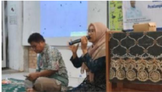
Gambar 3. Diskusi dan Tanya Jawab

Pengenalan aplikasi pencatatan keuangan sederhana seperti BukuKas dan Catatan Keuangan Harian mendapat respons positif dari peserta, meskipun sebagian masih merasa belum terbiasa dengan penggunaan aplikasi digital. Peserta menyatakan bahwa aplikasi tersebut dinilai praktis dan berpotensi memudahkan pencatatan keuangan usaha dibandingkan metode manual, khususnya dalam mencatat transaksi harian dan memantau arus kas.