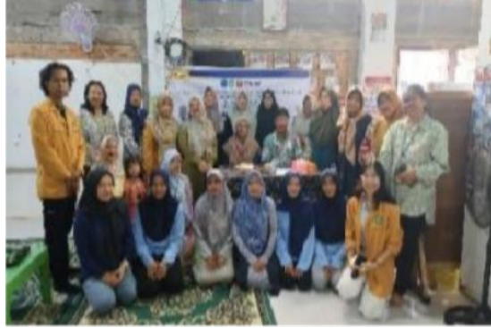
Gambar 4. Foto Bersama

Temuan ini sejalan dengan (Pratiwi et al., 2025) yang menegaskan bahwa peningkatan literasi keuangan perempuan memiliki kontribusi signifikan terhadap keberlanjutan usaha mikro dan kesejahteraan keluarga. Dengan adanya penyuluhan ini, peserta tidak hanya memperoleh pengetahuan teknis, tetapi juga motivasi untuk mengembangkan usaha bersama secara lebih profesional dan berkelanjutan.