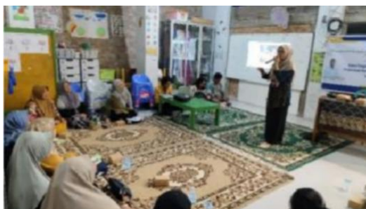
Gambar 3. Pemaparan Materi Pembukuan dan Laporan Keuangan

Pada aspek pembukuan, hasil kegiatan menunjukkan bahwa sebagian besar peserta sebelumnya belum melakukan pencatatan keuangan secara rutin dan sistematis. Pencatatan yang dilakukan masih bersifat sederhana dan tidak terstruktur, bahkan sebagian peserta mengakui belum pernah memisahkan antara keuangan usaha dan keuangan rumah tangga. Kondisi ini memperkuat temuan (Yuliana et al., 2025) yang menyatakan bahwa lemahnya pemisahan keuangan pribadi dan usaha menjadi kendala utama dalam pengelolaan UMKM mikro.