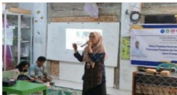
Gambar 2. Pemaparan Materi Manajemen Usaha Bersama (Sumber: Dokumentasi Tim Pengabdi, 2025)

Hasil pelaksanaan penyuluhan menunjukkan bahwa sebagian besar peserta sebelumnya menjalankan usaha rumah tangga secara informal tanpa perencanaan usaha yang jelas dan pembagian tugas yang terstruktur. Usaha yang dijalankan cenderung bersifat spontan, mengikuti kebutuhan jangka pendek, serta belum didukung oleh perencanaan produksi dan pemasaran yang sistematis. Melalui penyampaian materi manajemen usaha kecil, peserta mulai memahami pentingnya perencanaan usaha, pengorganisasian kelompok, dan pembagian peran dalam usaha bersama.