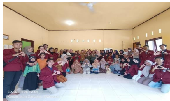
Gambar 5. Dokumentasi kegiatan Penyuluhan

Setelah pengisian kuesioner sudah dilakukan dengan foto bersama masyarakat sebagai dokumentasi kegiatan pengabdian kepada masyarakat. Kegiatan ini berjalan dengan lancar tanpa adanya kendala, dan antusiasme masyarakat terhadap pemaparan materi yang disampaikan oleh mahasiswa sangat tinggi. Masyarakat juga berpartisipasi aktif untuk bertanya mengenai materi yang belum mereka paham. Kami berharap dengan mengonsumsi ikan, masyarakat dapat menerapkan pola hidup sehat.