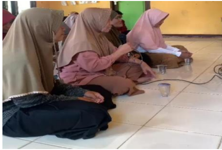
Gambar 3. Sesi Tanya Jawab

Kegiatan selanjutnya yaitu pengisian kuesioner melalui google form yang telah diberikan kepada masyarakat. Tujuan kuesioner ini yaitu untuk mengetahui bagaimana tingkat konsumsi ikan pada masyarakat beserta permasalahan yang dihadapi dalam mengonsumsi ikan. Dari data kuesioner yang telah diperoleh terdapat permasalahan yang dialami responden dalam mengonsumsi ikan, di mana sekitar 35,4% atau 23 responden menyatakan ada kendala khusus yang dialami saat mengonsumsi ikan, data tersebut dapat dilihat pada gambar 4.